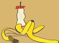
restos de fruta