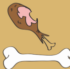
restos de carne y huesos