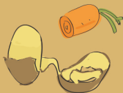
restos de verduras