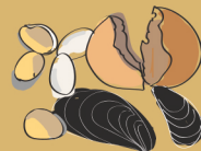
cáscaras (huevos, frutos secos, mariscos)